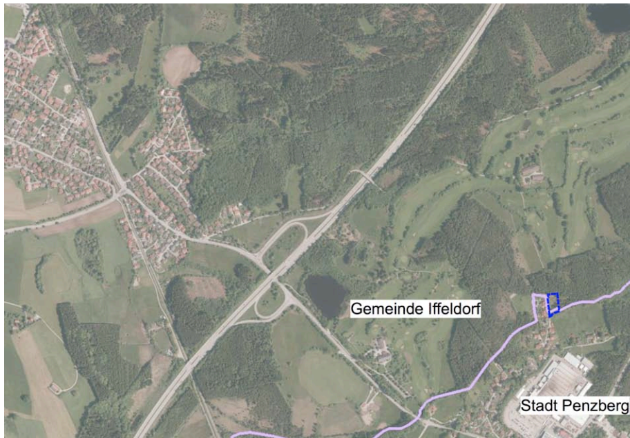
Lage im Gemeindegebiet (© DOP der Bayerischen Vermessungsverwaltung; o.M.)

Die Gemeinde Iffeldorf möchte mit der Ausweisung eines ca. 0,20 ha großen Wohngebiets am östlichen Rand ihres Gemeindegebiets in Abrundung der auf der Penzberger Gemeindegebiet unmittelbar angrenzenden vorhandenen und neu geplanten Bebauung auf zwei erschlossenen Grundstücken die Möglichkeit der baulichen Entwicklung geben.