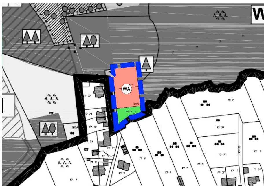
Entwurf Flächennutzungsplan 6. Änderung (o.M.)

Im rechtskräftigen Flächennutzungsplan ist der Änderungsbereich als Fläche für die Forstwirtschaft dargestellt.